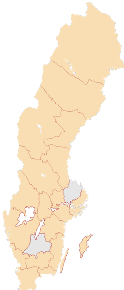
Karta över alla regioner som deltar i nationella projektet Rösträtt – sång på förskolan.

Norrlandsoperan markus.falck@norrlandsoperan.se