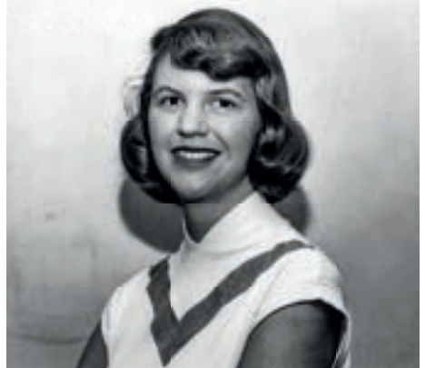
En ung Sylvia. Bilden är tagen en månad innan hennes död.

Operan Sylvia är inspirerad av Sylvia Plaths liv och romanen Glaskupan i en fri dramatisering.